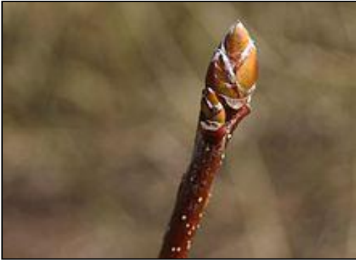
Esempio di gemma apicale, rampollo

I contadini in Mugello lo chiamavano più comunemente “ pollone ” o “ ributto ”.