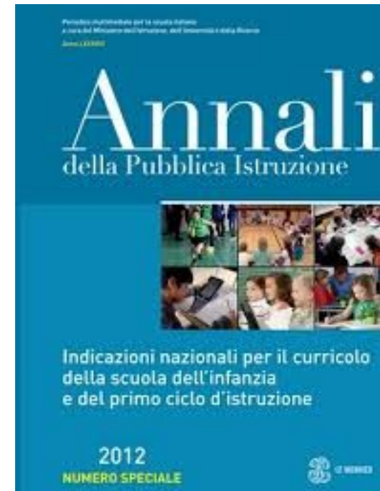
Fig. 1 Annali della Pubblica Istruzione

Gli interventi didattici, progettati e proposti per i nostri alunni, pertanto, mirano alla valorizzazione delle abilità linguistiche sui diversi usi della lingua (comunicative, euristiche, cognitive, espressive, argomentative).