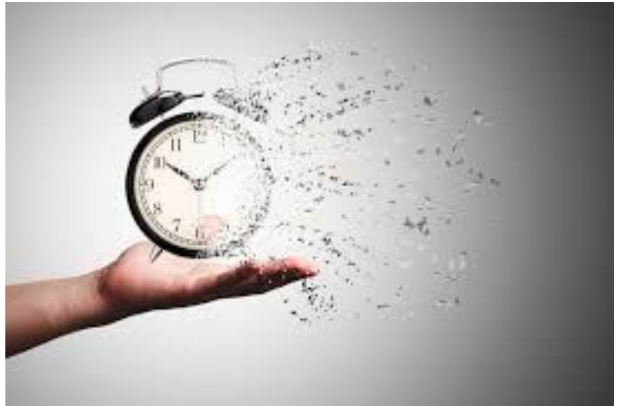
Fig. 2. Il tempo dedicato agli interventi didattici

12 ore con incontri di 1 o 2 ore a settimana.