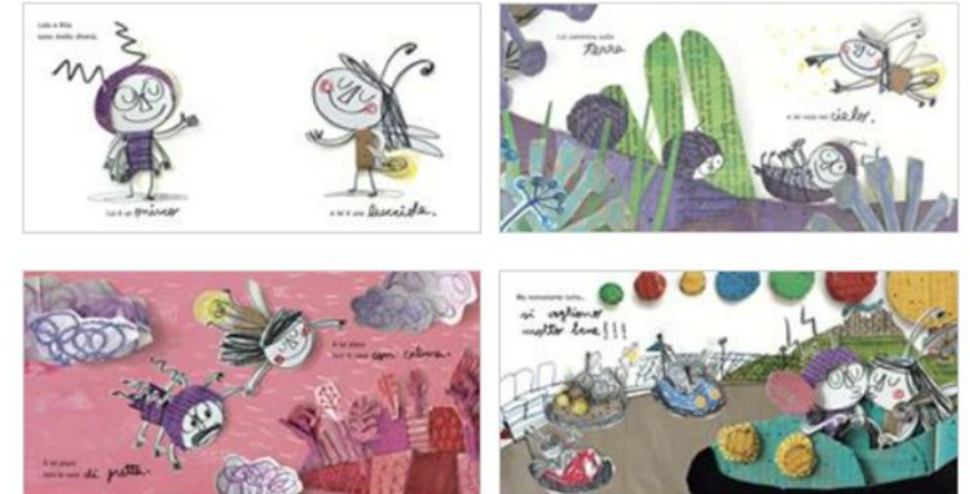
Fig. 3 Immagini dell'albo

https://www.lafeltrinelli.it/libro-dei-contrari-mi-piaci-libro-anna-lle-nas/e/9788858027172