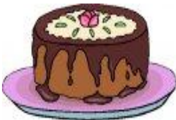
Torta con la glassa

soprattutto alcuni settori quali moda, abbigliamento, cucina e quotidianità, ha avuto influenza sulla nostra a prescindere dall'occupazione politica. Se entriamo in una pasticceria troveremo igné , dolci con la glassa , marron glacé , qualche profiterole , paste alla crema , meringhe , charlotte e, forse, anche delle crêpe suzette . Dopo esservi divisi in gruppi, scegliete, tra quelli proposti, due nomi di dolci per ciascun gruppo e cercate l'origine delle due parole, scrivendola accanto alle immagini che li rappresentano. Noi ve ne diamo una, a titolo di esempio, le altre immagini potete cercarle su Internet (ad esempio al link http://www.clipartgratis.it/ ) o disegnarle voi direttamente.