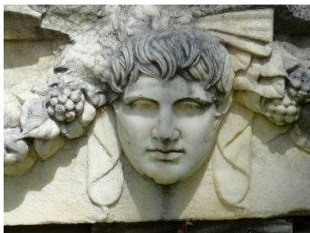
un rilievo romano con volto virile

L'aggettivo italiano “ virile ” indica ciò che è pertinente all'uomo. Tuttavia, come vuole l'etimologia latina, l'aggettivo ha oggi anche il valore di “serio”, “coraggioso”, “risoluto”.